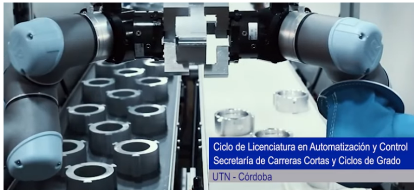
Ciclo de Licenciatura en Automatización y Control Secretaría de Carreras Cortas y Ciclos de Grado UTN - Córdoba

Secretaría de Carreras Cortas y Ciclos de Grado